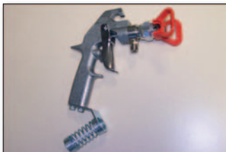
Graco® Airless Farb- Handspritzpistole

(U): Umkehrdüse (Drehdüse): für eher kleine Farbmengen; komfortable Reinigung