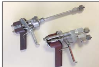
Airless 2K Handspritzpistole M 98:2 und M1:1