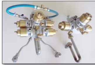
Airless 2K-Spritzpistole und Doppel-Spritzpistole M98:2 und M1:1